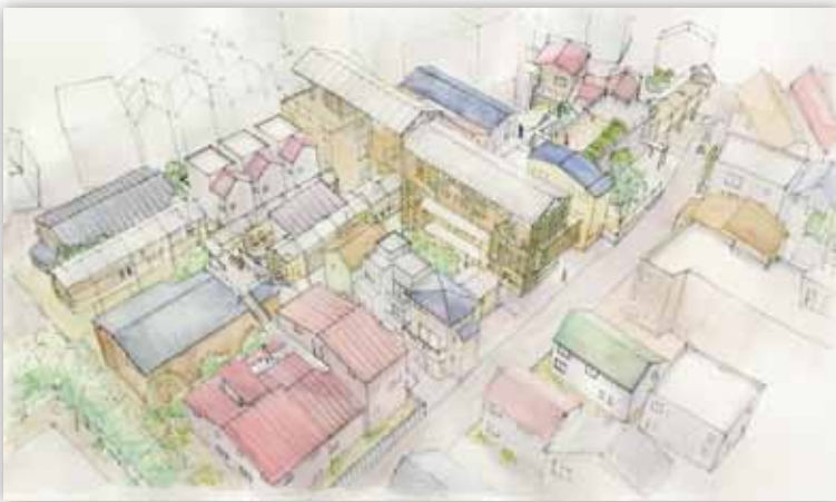
既存住宅の間に柵で構成されたシェアコミュニティコアが入り込む