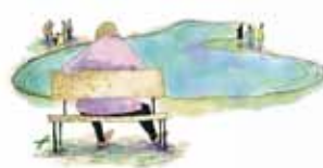
居心地の良い公園のコンテクスト