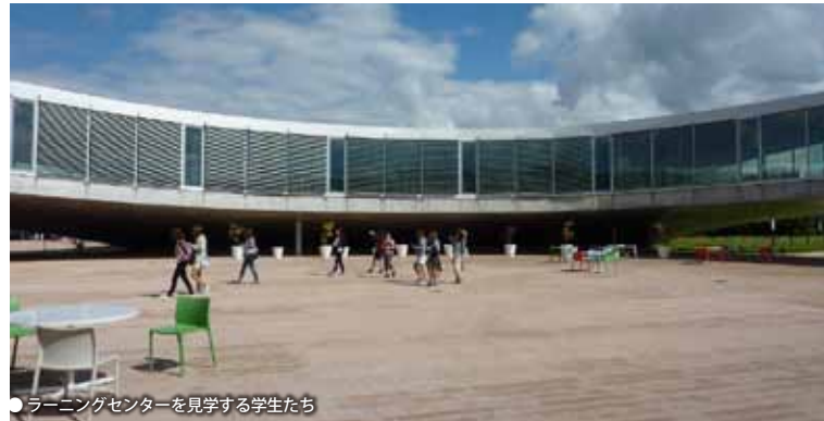
● ラーニングセンターを見学する学生たち