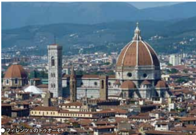
● フィレンツェのドゥオーモ