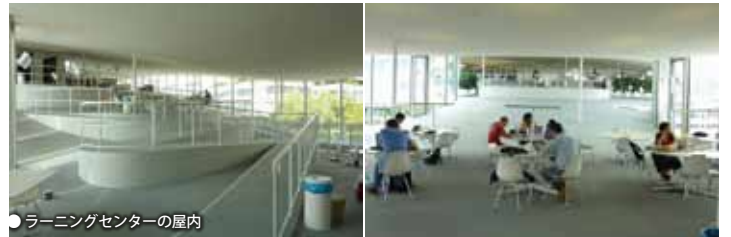
● ラーニングセンターの屋内