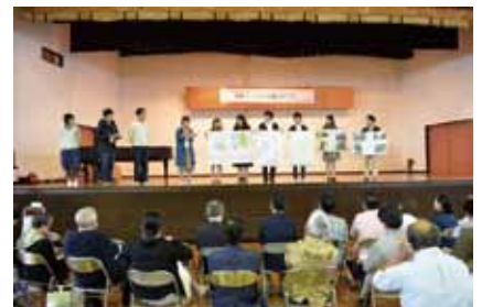
ディスカッションの様子