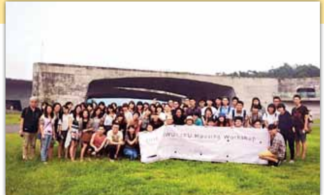
エクスカーシオン