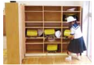
完成したロッカー

2015年9月より、豊明小学校の子どもたちが通うJWUほうめいこどもクラブという学童保育が開所しました。定行研究室では、クラブの開所のプロセスに関わり環境のセッティングを行っています。また、院生の修士論文として調査に協力していただいております。その一環で、子どもたち30人分のランドセルと靴を入れる棚が市販のものでは適当なものが見つからなかったため、研究室のメンバーで制作することになりました。考えた家具を設計し造り、実際に使用してもらう、という貴重な機会をいただきました。