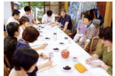
篠原研究室が担当したフィールド「新規移住者」でのインタビューの様子。