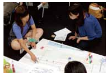
フィールド先で得た情報を地図に落とし込みながら議論する学生たち。