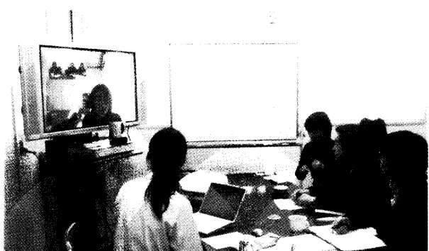
図2 テレビ会議システムを用いたU-リサーチャーとの研究ゼミ