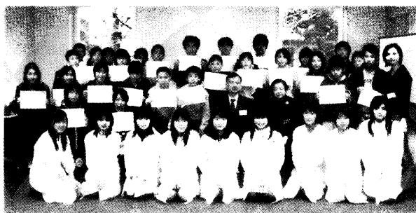
図3 電子情報通信学会との共催で開かれた科学教室

ポジウム終了後に実施し、就職相談やキャリアパスについての助言を得る機会を設けた。また、草の根eラーニングのポータルサイトを活用した就職・再就職支援サービスの提供・サイエンスカフェの開催によるコミュニティ形成の促進を行った。