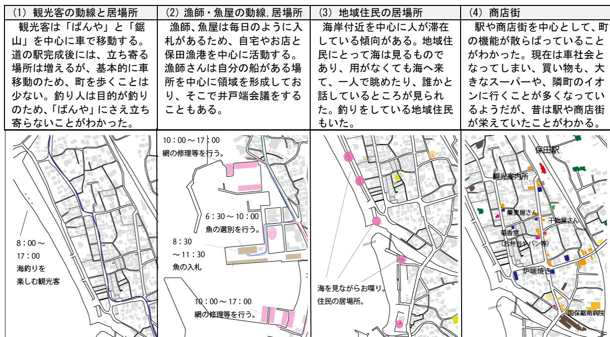
図3 町の機能と地域住民の日常についての調査結果

調査結果からは、自然・特産物の資源を支える「人材」が、鋸南町の貴重な資源である考えられる。特に、特産物（海産物、野菜、花など）の「生産者」は都市と地方をつなぐ接点となる可能性があるため、非常に重要な存在である。また、観光客は基本的に車で移動し、地域住民は海沿いに滞在しているなど、観光客と地域住民とが交わるような場所が少ないことが明らかとなった。地域住民も海沿い以外には滞在する場所があまりない。