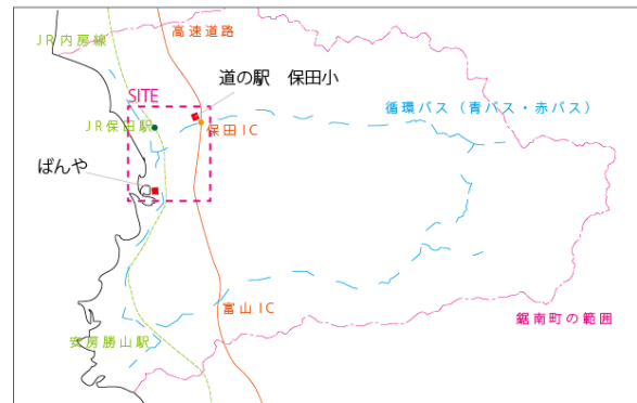
図5 鋸南町と計画地の関係

現在人気の観光拠点である「ばんや（食堂）」と今後、町の中心になるであろう「道の駅保田小（2015年冬開業予定）」は、鋸南町にとって都市と地域を結ぶ交流拠点である。そのため、ポテンシャルの高い、これら2つの拠点を含め、JR保田駅から徒歩圏内に8か所の交流拠点を形成する。