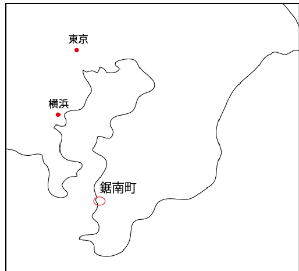
図 2 鋸南町の位置

平成 9 年の東京湾アクアライン開通により、東京都心から約 1 時間の時間距離で結ばれ、交通アクセスが非常に便利になった。また、JR 内房線が町西部を縦断し、町内に保田駅、安房勝山駅があり、特急さざなみ号で東京駅と約 1 時間 30 分で結ばれている。