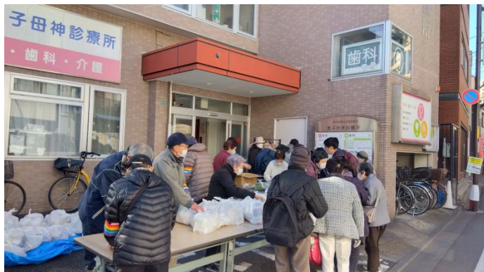
↑フードパントリー当日、配布様子

フードパントリー仕分けの様子→ 日本女子大の学生さんが1名 参加してくださいました